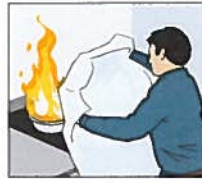
Brand i kastrull. Lägg på locket eller en brandfilt för att kväva branden. Använd aldrig vatten. Vatten får branden att spridas.