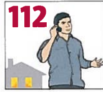
Ring 112 – berätta vad som har hänt och om någon är skadad, var hjälpen behövs och vem du är som ringer.