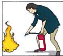
Rikta mot lågornas bas.