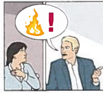
Rädda och varna andra som kan befinna sig i fara.

Rädda – Varna – Larma – Släck är normalt den ordning du kan följa om du upptäcker en brand. Men den verkliga situationen avgör vilken ordning som är bäst. Är ni flera kan ni hjälpas åt.