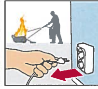
Brand i elektrisk utrustning. Dra ur kontakten innan du försöker släcka. Har du en pulversläckare kan du släcka direkt.