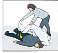
Brand i kläder. Försök få ner personen liggande. Kväv elden med en brandfilt eller vad som finns tillhands. Släck från huvudet och nedåt.