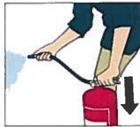
Tryck ner handtaget.