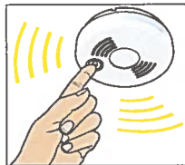
Testa brandvarnaren varje månad genom att trycka på testknappen.