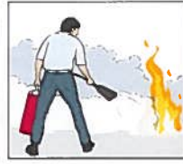
Släck branden om du bedömer att du klarar det.