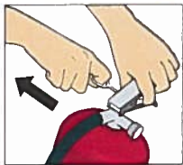
Dra ut säkringen.